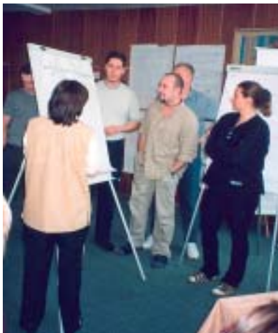
V rámci výcviku policisté společně řešili konkrétní modelové situace.

Bílý kruh bezpečí v roce 2003 realizoval pro Ministerstvo vnitra ČR vzdělávací projekt „Práce s obětí trestného činu“. Cílem jeho pilotní části, uspořádané ve spolupráci se Správou Severočeského kraje Policie ČR, byly příprava a realizace týdenního výcviku pro policisty, budoucí školitele. Ten se uskutečnil od 14. do 18. 4. 2003 v Ostrově (Ústí nad Labem) a zúčastnilo se ho 28 zkušených policistů ze tří krajů a dvě pracovnice Odboru prevence Ministerstva vnitra ČR. Bílý kruh bezpečí účastníkům nabídl pět programových bloků, řadu modelových situací k nácviku praktické činnosti. Každý ze šesti lektorů výcviku se autorsky podílel na tvorbě pomůcek pro výkon služby policistů (manuál a sada karet pro výkon).